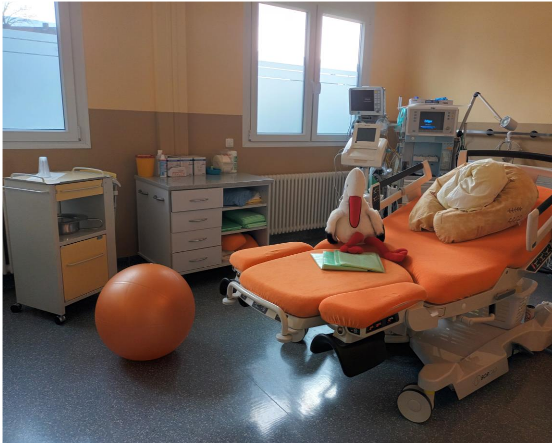
Sanfte Geburt im ELBLANDKLINIKUM Riesa

Es stehen verschiedene Hilfsmittel zur Lagerung, Entspannung aber auch zur Anregung der Beweglichkeit bereit, wie bspw. Seile, Pezzibälle, Gebärhocker, Matten.